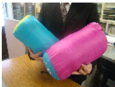
寝袋（大人用：筒型：軽量）

災害復興支援ボランティアに参加するためには、現地受け入れ団体・機関が定める装備が必要です。十分な装備のないまま現地に向かうと、大きな怪我・事故につながり、現地の方々の心を痛め、復興作業にも支障が出ます。しかし、初めて参加される方にとっては、装備品の準備だけでも時間とお金がかかります。そこで、静岡日本語教育センターでは、「一人でも多くの方にボランティアに関心を持っていただきたい」、「東日本大地震復興支援に向かう方々を支援したい」と考え、下記の作業用装備品の貸し出しを行います。