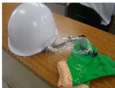
ヘルメット・ゴーグル・耐油ゴム手袋