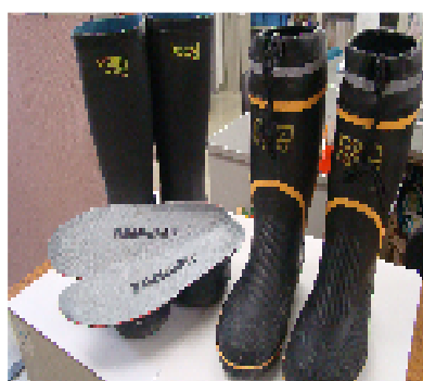
踏み抜き防止インソール