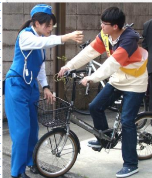
ट्राफिक सुरक्षा कक्षा