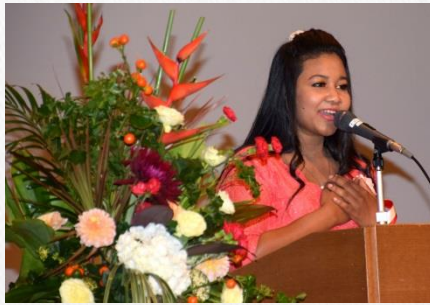
वक्तृत्व कला प्रतियोगिता