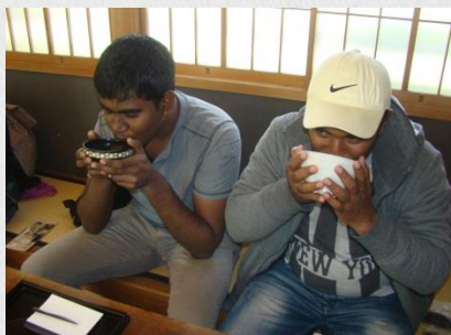
ओच्या बनाएर पिउने समारोहको अनुभव