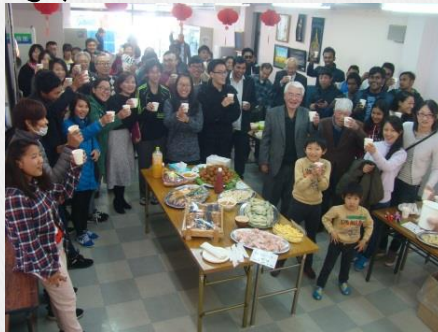
नयाँ वर्षको पार्टी